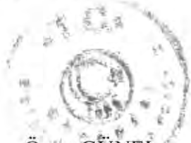
Ömer GÜNEL Meclis Başkanı