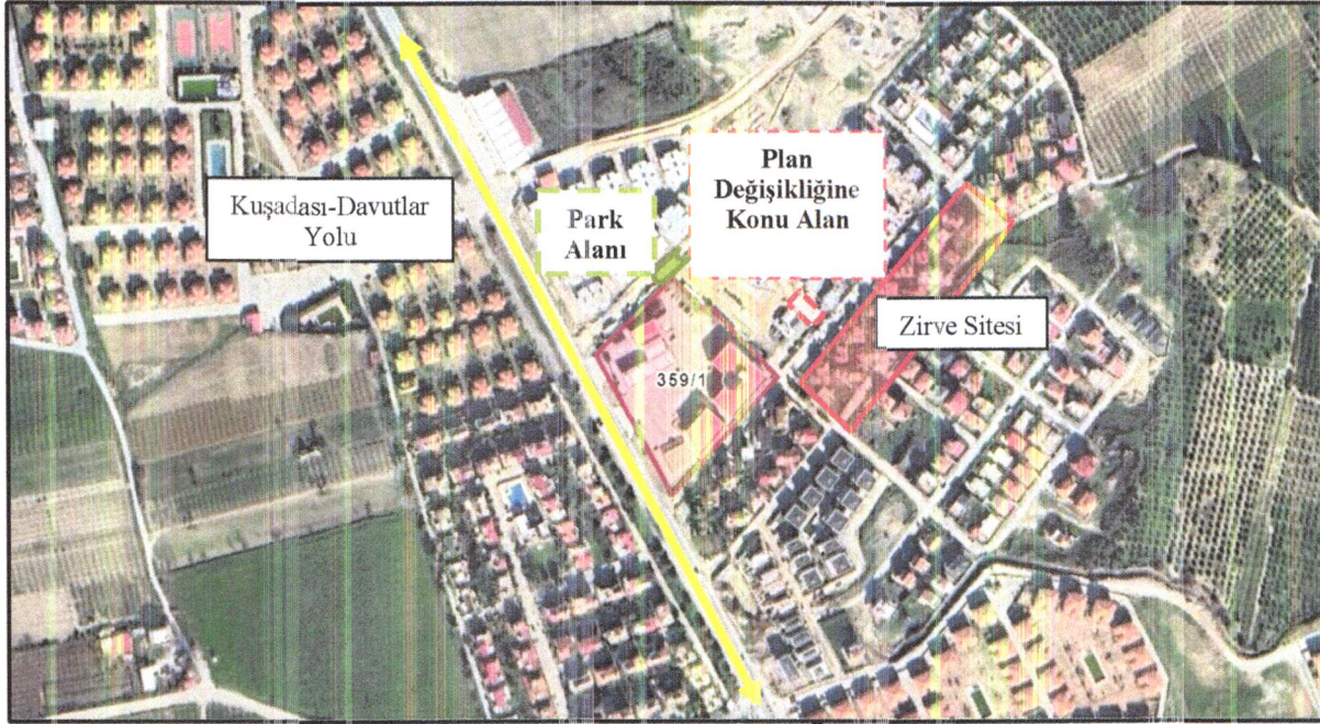
Görüntü 2: Plana Konu Alanın Uydu Görüntüsü Üzerindeki Yakın Konumu