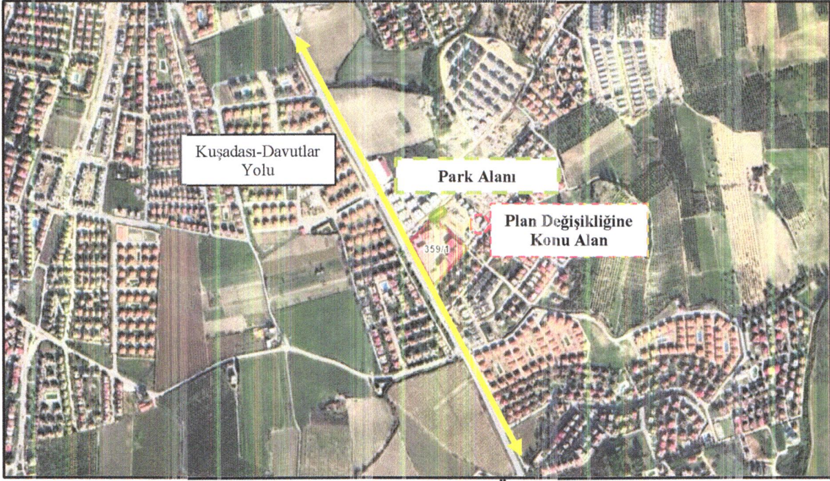
Görüntü 1: Plana Konu Alanın Uydu Görüntüsü Üzerindeki Uzak Konumu