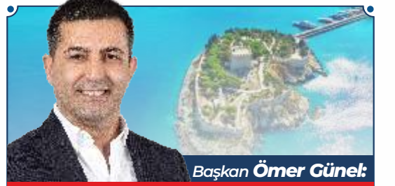
Başkan Ömer Günel:

Yeni pandemi tedbirleri ile birlikte Kuşadalılar evlerinde kalmayı sürdürürken Kuşadası Belediyesi, bu süreci hizmet üretmek için fırsata çevirdi. Aydın Büyükşehir Belediyesi ile iş birliği içerisinde bir yandan kentin turistik çarşılarında ve farklı mahallelerde alt ve üst yapıyı yenileme çalışmaları yürüten Kuşadası Belediyesi, bir yandan da pandemi süreci ile birlikte değişen turizm anlayışına uygun projeler geliştiriyor. Koronavirüsle mücadele tedbirleri ise elden bırakılmıyor.