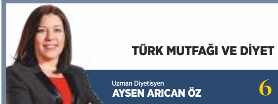
TÜRK MUTFAĞI VE DİYET