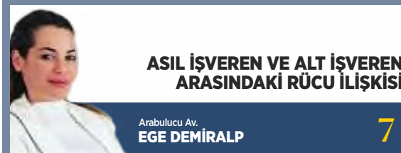
ASIL İŞVEREN VE ALT İŞVEREN ARASINDAKİ RÜCU İLİŞKİSİ