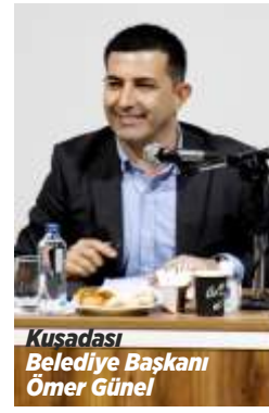
Kuşadası Belediye Başkanı Ömer Günel

Kuşadası Su Ürünleri Kooperatifi'nin yeni yönetimi ile yaptıkları görüşmeler sonucunda karşılıklı olarak açılan davaların geri çekilmesine karar verildiğini belirten Başkan Ömer Günel "Biz balıkçı esnafının memnuniyetini isteriz. Kooperatifimizin başkanı ve yönetimi ile görüşerek kendilerine Balık Hal'i'nin üst katında yer alan Balıkçı Kahvesi'nde 150 metrekarelik bir alan tahsis edilmesi yönünde mutabakata vardık. Kooperatif bu alanı hem lokal hem de yönetim ofisi olarak kullanacak" dedi. Kuşadası Belediyesi'nin Balıkçı Kahvesi'nin bulunduğu katı bütünüyle yenileyeceğini vurgulayan Başkan Ömer Günel, her zaman balıkçı esnafının