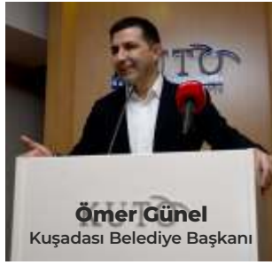
Ömer Günel Kuşadası Belediye Başkanı