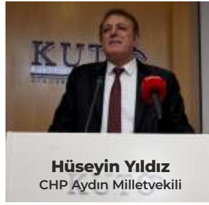
Hüseyin Yıldız CHP Aydın Milletvekili

ruz. Limana yaşanan gemilerde tura çıkmayan yolcuların ve turdan dönen yolcuların esnafa nasıl ulaşmasını sağlayabiliriz bu konuları görüşeceğiz. Kuşadası'nın merkezini destinasyon haline getirmeyi planlıyoruz. Gemideki turistlerin plajlarımızda denize girdikten sonra geri kalan zamanını kent merkezinde geçirmesini istiyoruz. Yaratacağımız turistik destinasyonları gezdikten sonra esnafımızdan alışveriş yaparak gemisine dönmesini sağlayacağız. Tabi burada esnafımızda büyük görev düşüyor. Burada Kuşadası'na kruvaziyer müjdesi veriyoruz. Esnafımızda bu konuda duyarlı davranması büyük önem taşıyor. Turistin rahat bir şekilde kenti dolaşması gerekiyor. Kısacası bu kadar uzun süreli bir kayıp dönemden sonra yeni ka-